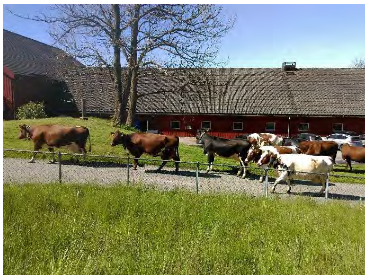
Stend jordbruksskole mai 2018